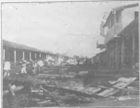
Batubano.—Calle obstruida por maderas después de la inundación.

en lo posible los daños materiales que el ciclón ha producido.