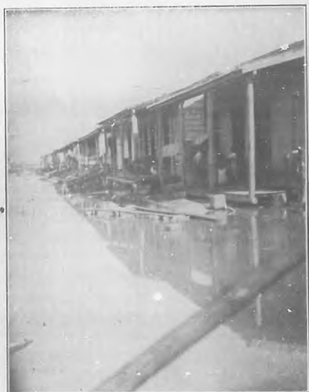
Batubano.—Las calles inundadas.