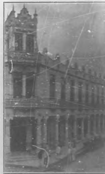
(Pinar del Río) Hotel Guatier, que ha sufrido desperfectos de consideración.