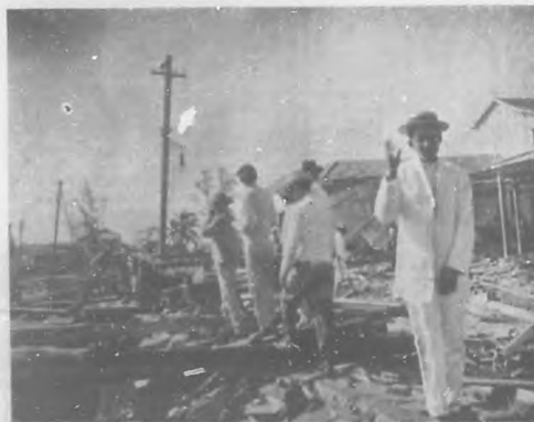
Batubano.—Ruinas de edificios.

Ahora la caridad o ha iniciado una suscripción nacional para reunir fondos con que remediar