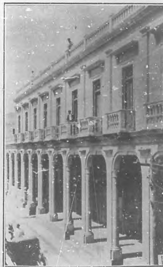
(Pinar del Río) Hotel Ricardo, que sufrió grandes daños.

Es ella la de altruismo que ha dado la población en masa. Lo mismo en los hogares santuosos que en los más humildes, encontraron momentaneo albergue las familias arrojadas de su casa por la amenazadora inundación.