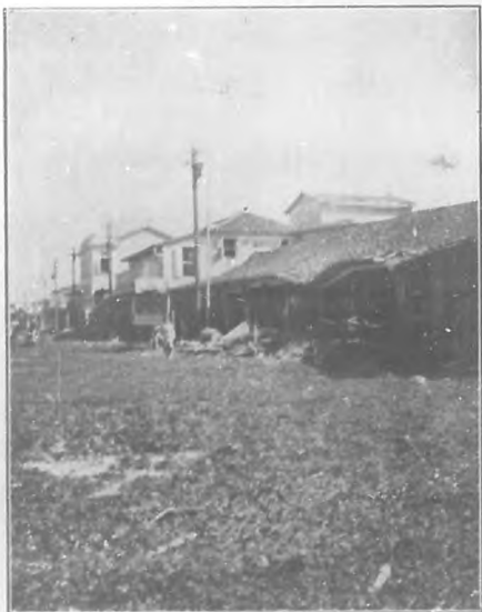
Batubano.—Mazo del mar depositado en las calles.