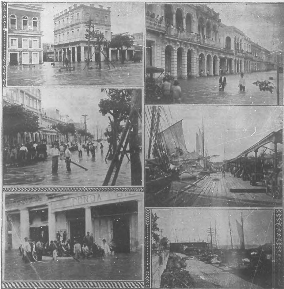
Vistas del Prado inundado.—El muelle de Paula: los tinglados después del ciclón.