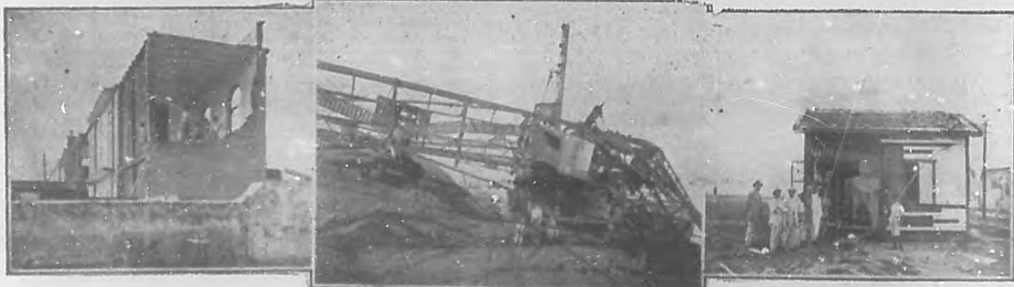
Caseta de la telegrafía sin hilos lanzada á gran distancia.—Tramontana de la carbonera de Casa Blanca, destrozada por el ciclón que al derrumbarse en parte, en Compostela y Desamparados, ocasionó el derrumbe total de la casa contigua.